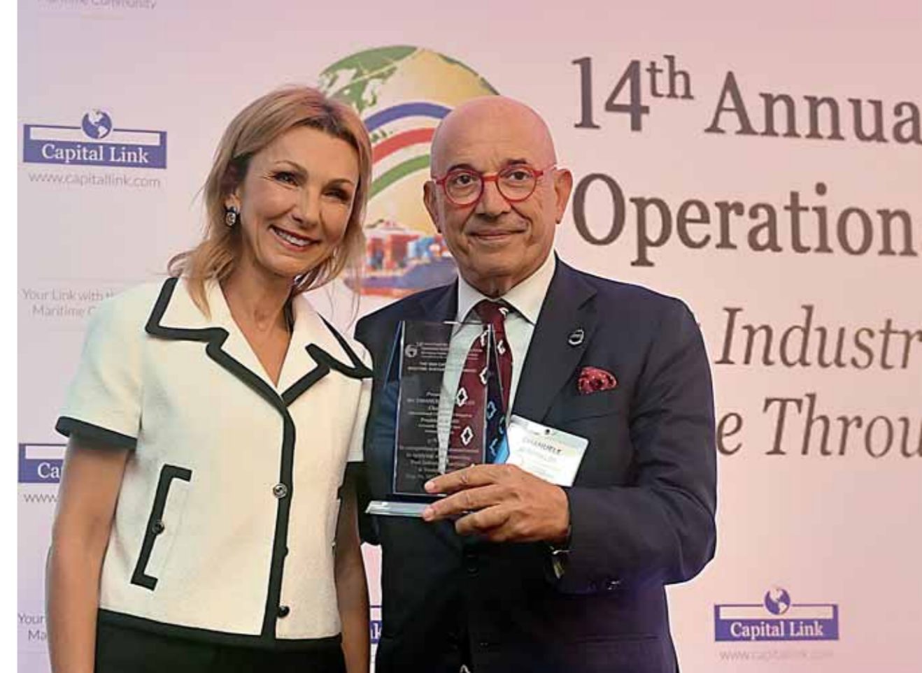
Με την πρόεδρο της Ένωσης Ελλήνων Εφοπλιστών

«ΠΡΩΤΑΓΟΝΙΣΤΙΚΟΣ Ο ΡΟΛΟΣ ΤΗΣ ΕΛΛΑΔΑΣ ΩΣΤΕ ΝΑ ΞΕΚΛΕΙΔΩΣΕΙ Η ΜΕΤΑΦΟΡΑ ΦΙΛΟΠΕΡΙΒΑΛΛΟΝΤΙΚΩΝ ΚΑΥΣΙΜΩΝ»