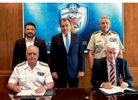
Ο αρχηγός ΓΕΝ αντιναύαρχος Στυλιανός Πετράκης ΠΝ και ο πρόεδρος του Ιδρύματος Αικατερίνης Λασκαρίδη, ναύαρχος ε.τ. Πάνος Λασκαρίδης. Πίσω τους, ο υπουργός Εθνικής Άμυνας Νίκος Παναγιωτόπουλος με τον υφυπουργό Νίκο Χαρδαλιά και τον αρχηγό ΓΕΕΘΑ στρατηγό Κωνσταντίνο Φλώρο

Σε ακόμη μια σημαντική δωρεά προς το Πολεμικό Ναυτικό προχώρησε ο Πάνος Λασκαρίδης, με στόχο αυτή τη φορά την ενίσχυση της υγειονομικής περιθαλψής. Ο πρόεδρος του Ιδρύματος Αικατερίνης Λασκαρίδη και ναύαρχος ε.τ. υπέγραψε από κοινού με τον αρχηγό ΓΕΝ αντιναύαρχο Στυλιανό Πετράκη πρωτόκολλο ανάληψης έργων αναβάθμισης και εκσυγχρονισμού του Ναυτικού Νοσοκομείου Αθηνών, παρουσία του υπουργού Εθνικής Άμυνας Νίκου Παναγιωτόπουλου, του υφυπουργού Νίκου Χαρδαλιά και του αρχηγού ΓΕΕΘΑ στρατηγού Κωνσταντίνου Φλώρου. Πέραν του εκσυγχρονισμού στη θεραπευτική αγωγή και την υγειονομική περίθαλψη προς τα στελέχη του Πολεμικού Ναυτικού και τις οικογένειές τους, η δωρεά επιπλέον