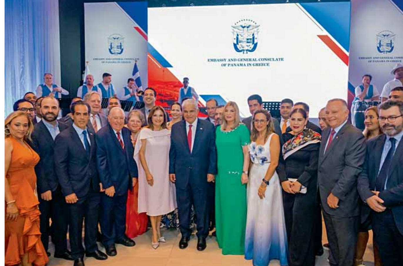
Αναμνηστική φωτογραφία από τη δεξίωση στο πλαίσιο των Ποσειδωνίων

Το εγκώμιο της ελληνικής ναυτιλίας έπληξε η παναμαϊκή αποστολή στα Ποσειδώνια, με επικεφαλής τον αρχηγό του κεντροαμερικανικού κράτους. Δεσμοί δεκαετιών βασισμένοι στην ποσότητα, στην ποιότητα, στο όραμα και την εμπιστοσύνη