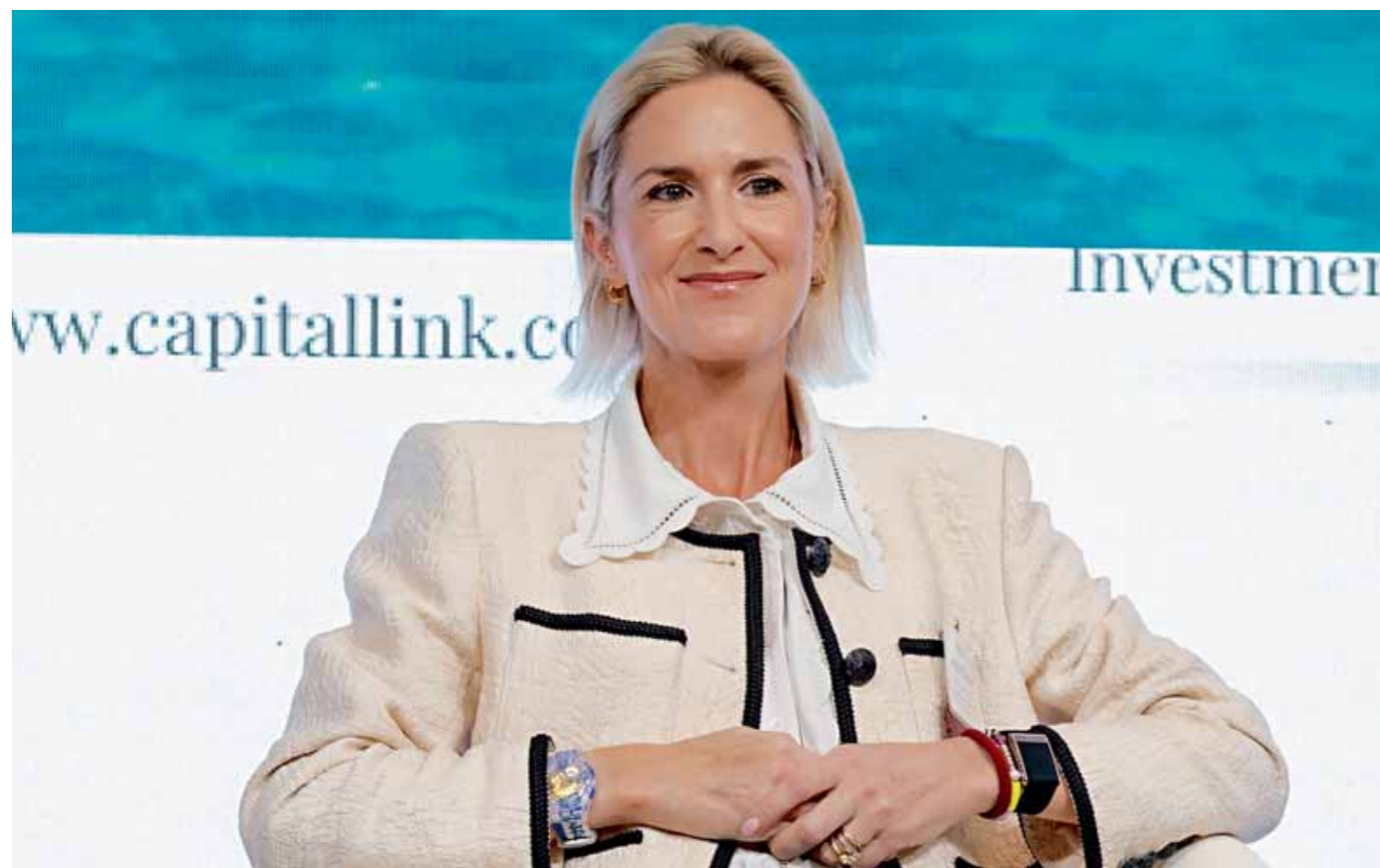
➤ ΜΑΡΙΑ ΑΓΓΕΛΙΚΟΥΣΗ • MARAN TANKERS • Επένδυση στα πλοία και στον άνθρωπο • σελ. 26