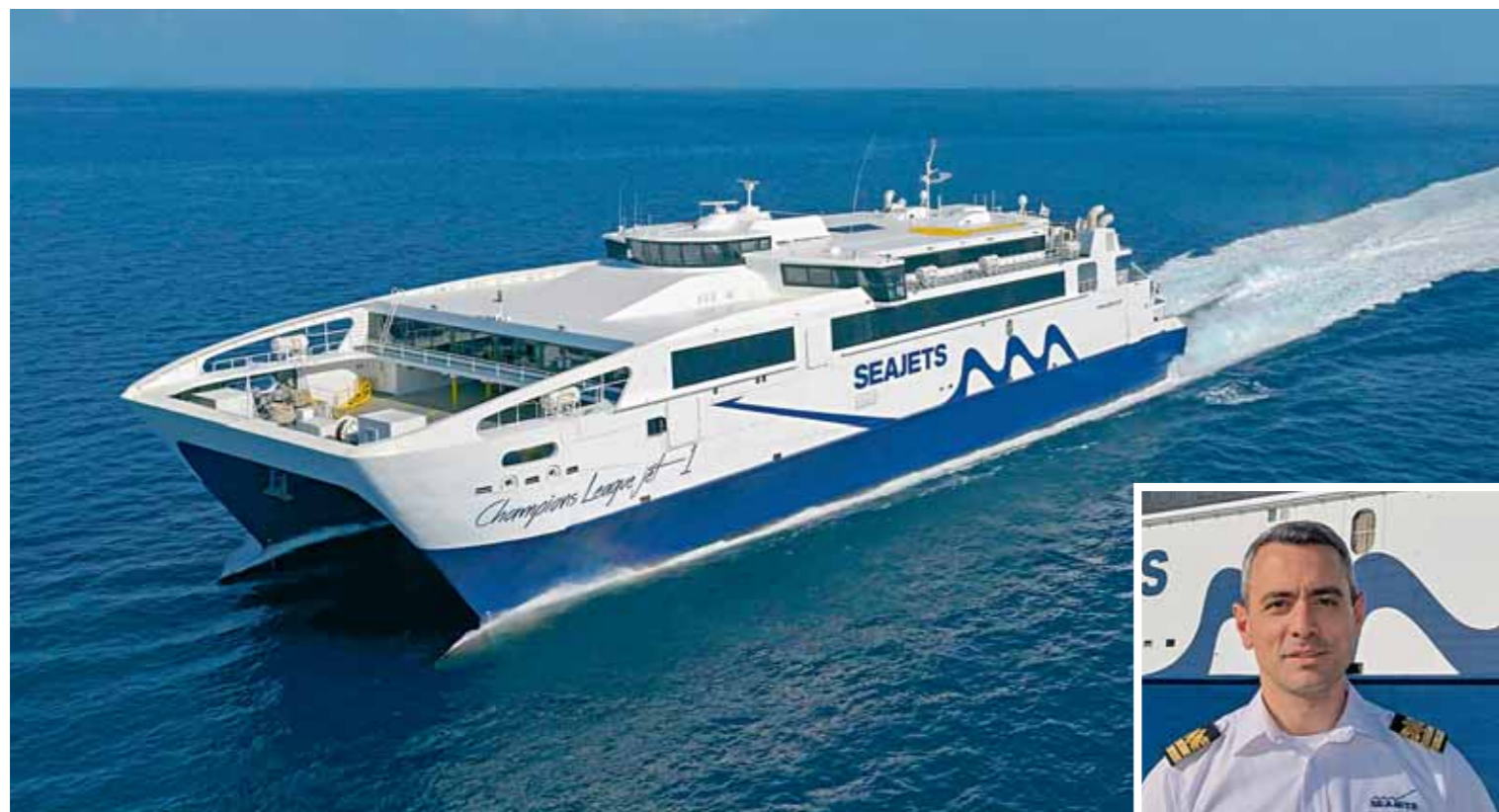
➤ CHAMPIONS LEAGUE JET 1 • Cpt Γιώργος Συρίγος • σελ. 94