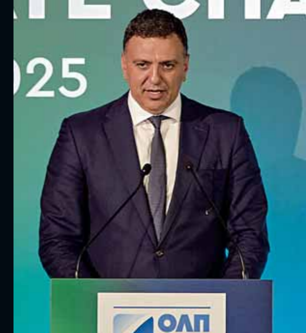
Πάνω: Ο υπουργός Ναυτιλίας Βασίλης Κικίλιας Κάτω: Ο δήμαρχος Πειραιά Γιάννης Μώραλης

που αποσκοπεί στην ανθεκτικότητα και βιωσιμότητα των λιμενικών υποδομών, καθώς και τις δράσεις που καθιστούν πρωτοπόρο το λιμάνι του Πειραιά όσον αφορά την ευαισθητοποίηση και ετοιμότητα για την κλιματική αλλαγή. Η μελέτη εκπονήθηκε σε συνεργασία με