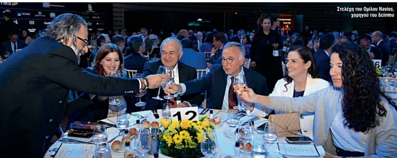
Στελέχη του Ομίλου Navios, χορηγού του δείπνου

Ο πρόωρος θάνατος του Δημήτρη Μανιού το 1995, σε ηλικία 43 ετών, στέρησε από την ελληνική ναυτιλία έναν νεαρό μεγιστάνα που είχε αρχίσει να συγκρίνεται με το πρότυπο του «χρυσού Έλληνα» εφοπλιστή Αριστοτέλη Ωνάση