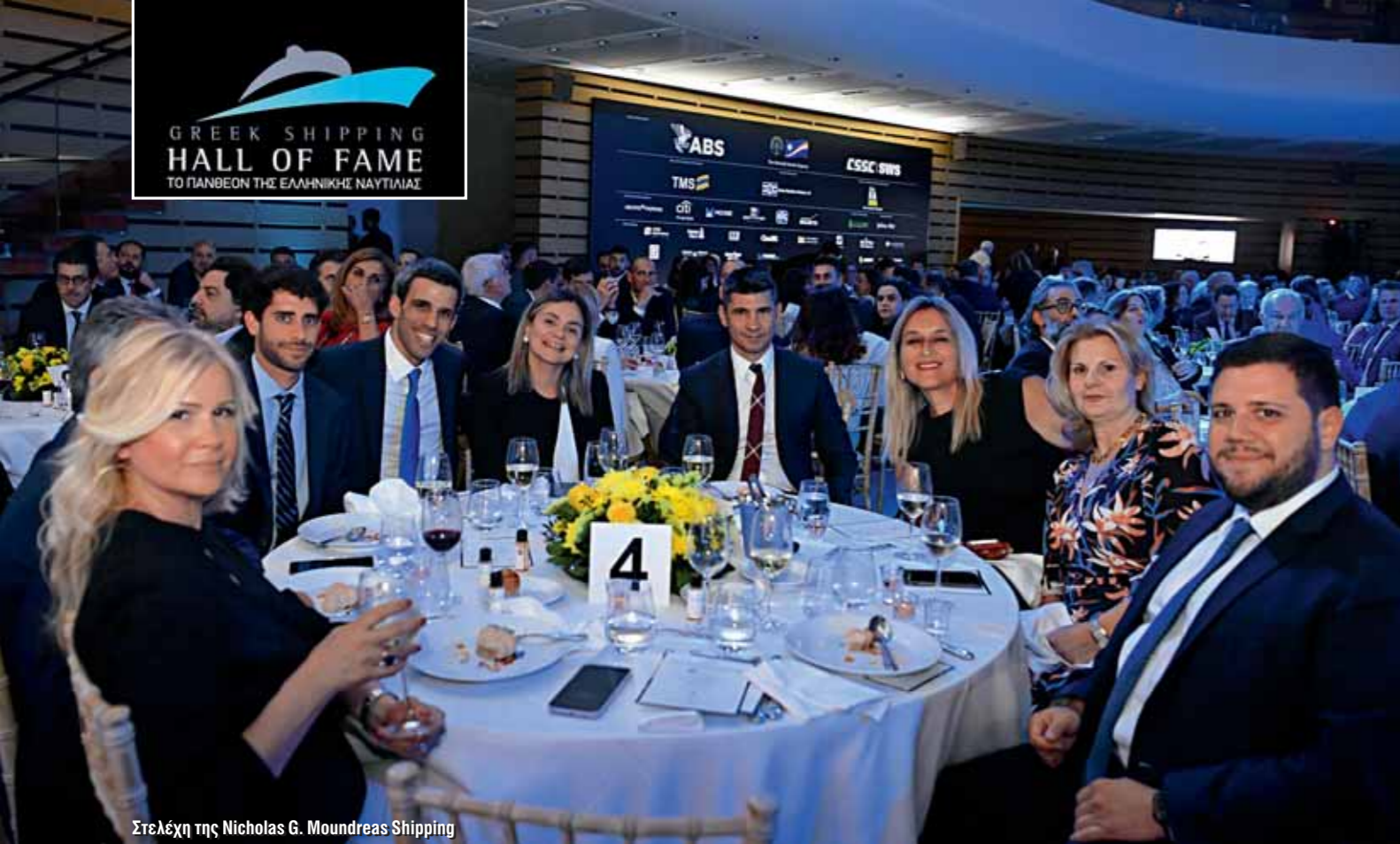
Στελέχη της Nicholas G. Moundreas Shipping

σαν οι Cass Technava, Cayman Registry, China Classification Society, ClassNK, Columbia Shipmanagement, Franman, Isle of Man Ship Registry, Kyvernitis Travel, Lloyd's Register, Marichem-Marigases, Marine Support, Marine Tours, Monjasa, Spheric Capital, Swift Marine και Timagenis Law Firm. Το Πάνθεον της Ελληνικής