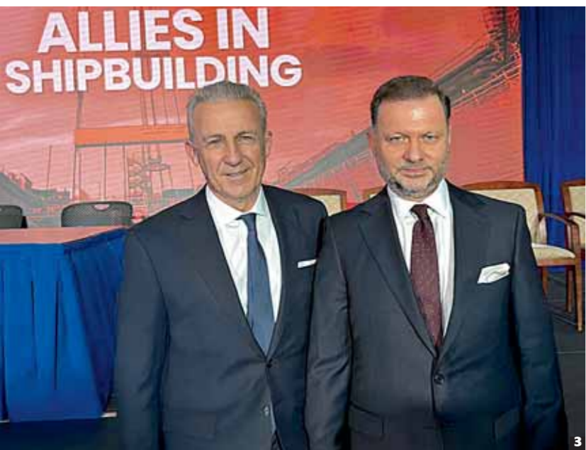
1. Με τον υπουργό Εξωτερικών Γιώργο Γεραπετρίτη. 2. Με την πρέσβειρα των ΗΠΑ στην Ελλάδα Κίμπερλι Γκιλφίλ και τον πρέσβη της Ελλάδας στις ΗΠΑ Αντώνη Αλεξανδρίδη. 3. Με τον διευθύνοντα σύμβουλο της Onex Group Πάνο Ξενοκόστα στο Υπουργείο Μεταφορών των ΗΠΑ, στο πλαίσιο υπογραφής της συμφωνίας μεταξύ της Onex και της Hanwha Power Systems