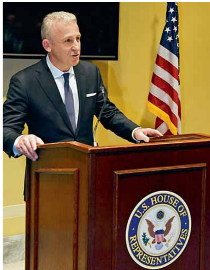
Ο Κωστής Φραγκούλης στην πρώτη του ομιλία στις ΗΠΑ, μετά την ανάληψη της προεδρίας του διεθνούς Οργανισμού

Ακόμη, σε εκδήλωση του DC Propeller Club είχε την ευκαιρία να εκφωνήσει την πρώτη του ομιλία στις ΗΠΑ μετά την ανάληψη της προεδρίας του, και μάλιστα σε έναν ιδιαίτερα συμβολικό χώρο, όπως το Καπιτώλιο. Στην τοποθέτησή του ανέδειξε τον ιστορικό αλλά και διεθνή χαρακτήρα του Οργανισμού, επισημαίνοντας: «Το Propeller Club γεννήθηκε εδώ. Η κληρονομιά και οι βάσεις του είναι αμερικανικές, όμως η κοινότητά του –ακριβώς όπως και η ναυτιλία– είναι βαθιά διεθνής. Και αυτή η διεθνής διάσταση δεν είναι συμβολική, αλλά ουσιαστική και θεμελιώδης». Επιπλέον, υπογράμμισε τη σημασία της ελληνοαμερικανικής συνεργασίας στον ναυτιλιακό τομέα σημειώνοντας: «Βρίσκομαι εδώ όχι μόνο ως πρόεδρος του International Propeller Club, αλλά και ως εκπρόσωπος της ελληνικής ναυτιλιακής κοινότητας. Επιθυμώ, ως εκ τούτου, να επιβεβαιώσω τους ισχυρούς δεσμούς