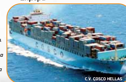
C.V. COSCO HELLAS