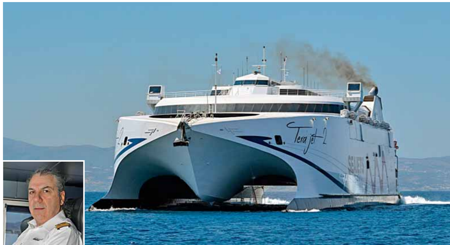
➔ TERA JET • Cpt Θανάσης Ιωάννου • Στις Κυκλάδες • σελ. 64