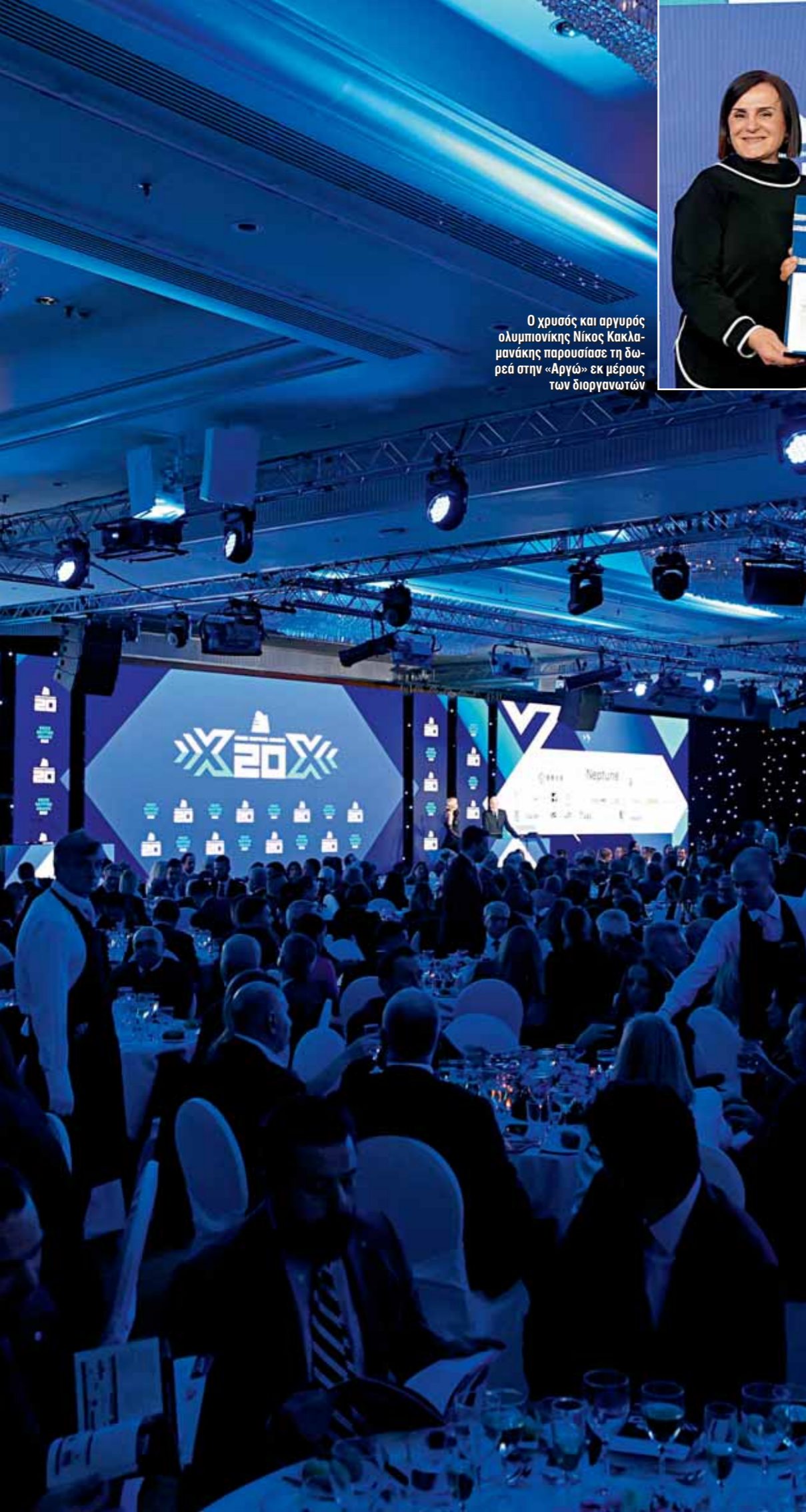
Ο χρυσός και αργυρός ολυμπιονίκης Νίκος Κακλαμανάκης παρουσίασε τη δωρεά στην «Αργώ» εκ μέρους των διοργανωτών