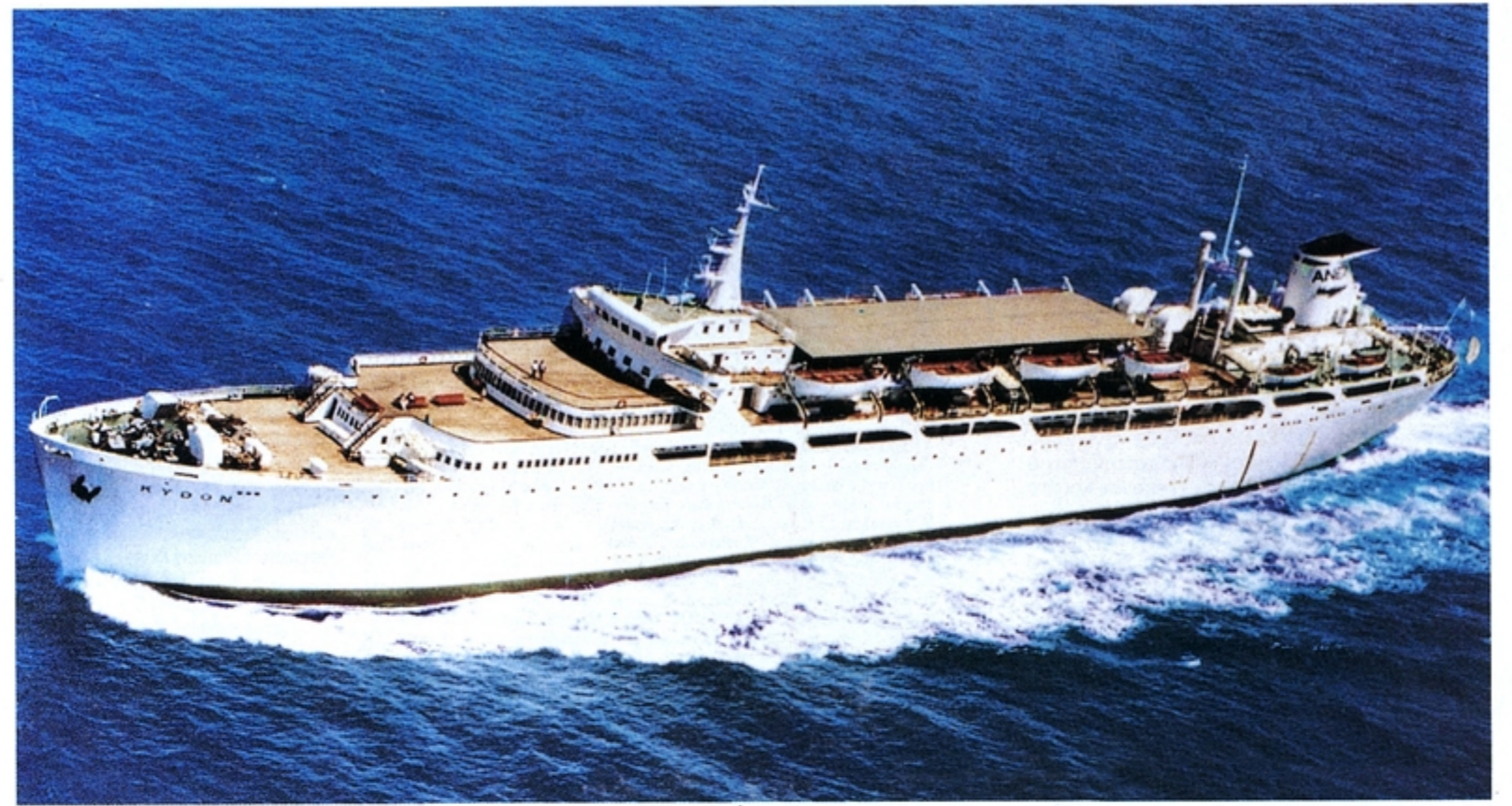
Το ΚΥΔΩΝ, πρώτο πλοίο εταιρείας λαϊκής βάσης και δικαίωση του Κ. Αρχοντάκη και των άλλων πρωτεργατών της Α.Ν.Ε.Κ.

«Έπρεπε, κατά τη γνώμη μου, να καταφέρουμε να αξιοποιήσουμε την έντονη συναισθηματική φόρτι-