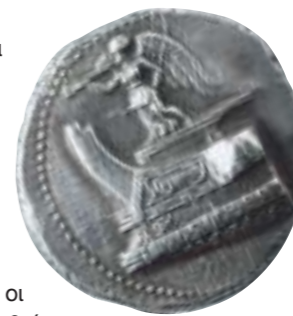
Ασημένιο τετράδραχμο του Δημητρίου του Πολιορκητή, 306-283 π.Χ.

Α ν παρατηρήσει κανείς ακόμα και σήμερα τις πλώρες των καϊκιών και των άλλων μικρών σκαφών, μπορεί συχνά να διακρίνει ζωγραφισμένο εκεί ένα ρόμβο ή ένα δίσκο ή ένα άστρο ή ακόμα μια γεωμετρική μαργαρίτα. Συχνά το σύμβολο αυτό, γιατί για κατάλοιπο κάποιου παλιού συμβόλου πρόκειται, βρίσκεται στην άκρη μιας φάσας διαφορετικού χρώματος που συχνά σχεδιάζεται εξωτερικά στο παραπέτο. Κάπως πιο σπάνια το βρίσκουμε σχεδιασμένο σε πλώρες μεγαλύτερων πλοίων. Σε πρώτο κοίταγμα το σχεδιασμά αυτό μοιάζει με ένα απλό διακοσμητικό μοτίβο ή με ένα κομψό καλλιτεχνικό τελείωμα της μοντονίας της λωρίδας που περιβάλλει το πάνω μέρος της κουπαστής του σκάφους. Μια όμως πιο προσεκτική παρατήρηση και κάποια έρευνα και μελέτη τόσο παλαιότερων παραστάσεων όσο και περι-