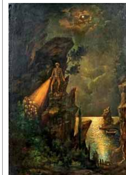
«Διαφυγή 1941-44. Αγωνιστές οδηγούνται προς το ΕΥΑΓΓΕΛΙΣΤΡΙΑ». Ελαιογραφία του Θεμιστοκλή Καρφάκη (50x70 εκατ.). Ναυτικό Μουσείο Κρήτης

Service Order) και OBE (Order of British Empire). Ο Χούμας εντάχθηκε με το καϊκι ΕΥΑΓΓΕΛΙΣΤΡΙΑ στη Συμμαχική Οργάνωση Διαφυγής «MI 9» (Military Intelligence 9) από τον Άγγλο ταγματάρχη Michael Wood-