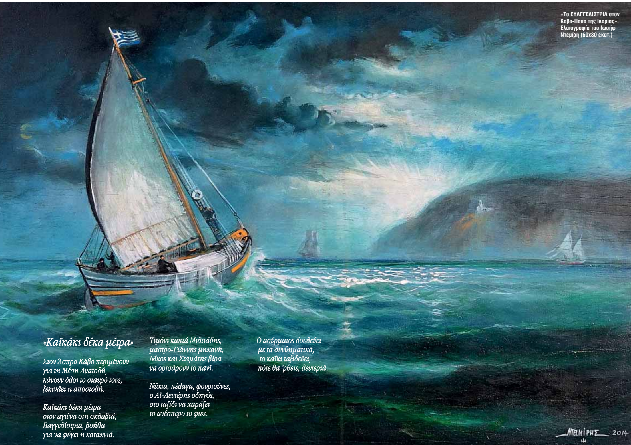
«Το ΕΥΑΓΓΕΛΙΣΤΡΙΑ στον Κάβο-Πάπα της Ικαρίας». Ελαιογραφία του Ιωσήφ Ντεμιρή (60x80 εκατ.)