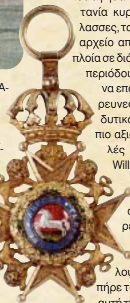
Το παράσημο Knight Commander του Sir John Franklin που βρέθηκε από τους μετέπειτα ερευνητές

λο βαθμό χαρτογραφηθεί. Από το 1670, αξιοποιώντας τις πρώιμες έρευνες ανδρών, όπως ο Frobisher και Davis, ο Hudson και Baffin, είχε ιδρυθεί με βασιλικό διάταγμα ένας σταθμός εμπορίας γούνας στον Βορρά από την εταιρεία Hudson's Bay Company. Αυτή η εταιρεία, που είχε στην κατοχή της ένα μεγάλο μέρος από τον σημερινό Καναδά, ίδρυε σταθμούς και βιοτεχνίες στις ακτές του Hudson Bay και ακολούθως κατά μήκος των μεγάλων ποταμών του Βορρά και των Βραχωδών Όρων.