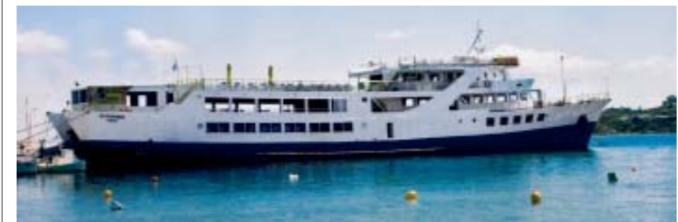
Στον Όρμο Παναγίας το 2005