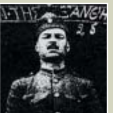
Ο λαϊκός βάρδος Κώστας Ρούκουνας, όταν ήταν στρατιώτης. Η ευαισθησία του έκανε τραγούδι την πολύνεκρη τραγωδία έξω από το λιμάνι του Πειραιά. η μεταξική δικτατορία ωστόσο επέβαλε την απόσυρση του δίσκου