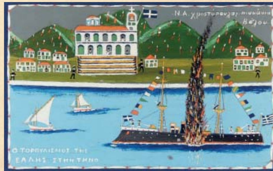
Ο τoρπιλισμός της «Ελλης» στην Τήνο (35 x 25 εκ., x.x.)

Έτσι αποφάσισα να πάω να ιδώ το ζωγράφο και να γνωρίσω τη δουλειά του, μήπως και μπορέσω να βρω περισσότερες πληροφορίες από εκείνες που είχα ως τότε συλλέξει, και μάλιστα από κάποιον που γνώριζε το αντικείμενο από πρώτο χέρι. Ήξερα άλλωστε πως είναι ευνόητη η προσήλωση του λαϊκού ζωγράφου στην αυθεντικότητα ▶