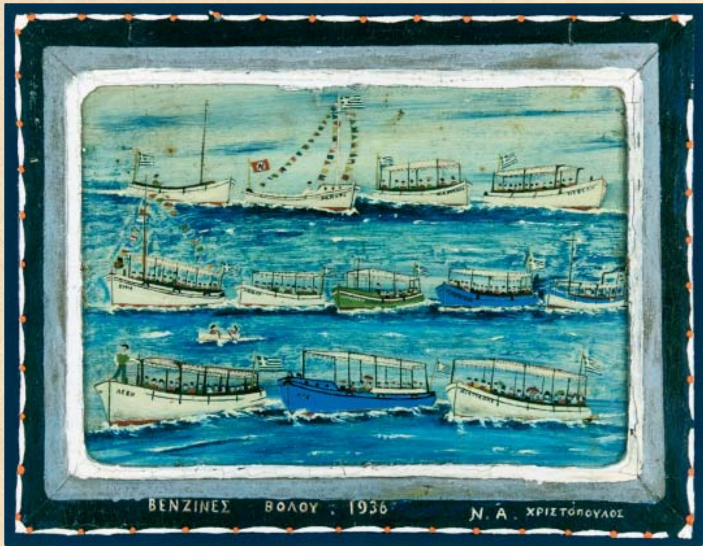
BENZINES ΒΟΛΟΥ 1936 Ν. Α. ΧΡΗΣΤΟΠΟΥΛΟΣ