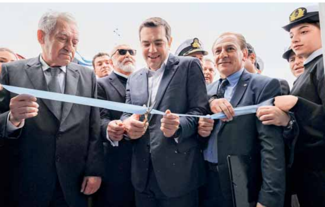
Ο πρωθυπουργός Αλέξης Τσίπρας κόβει την καρδέλα, μαζί με τον υπουργό Ναυτιλίας Φώτη Κουβέλη και τον δήμαρχο Καλύμνου Γιάννη Γαλουζή

Την Ακαδημία Εμπορικού Ναυτικού Καλύμνου εγκαινίασε ο πρωθυπουργός Αλέξης Τσίπρας, υλοποιώντας στην ώρα της μια από τις προσωπικές του δεσμεύσεις προς τους νησιώτες. Ζητούμενο η ναυτική εκπαίδευση και η νησιωτική πολιτική